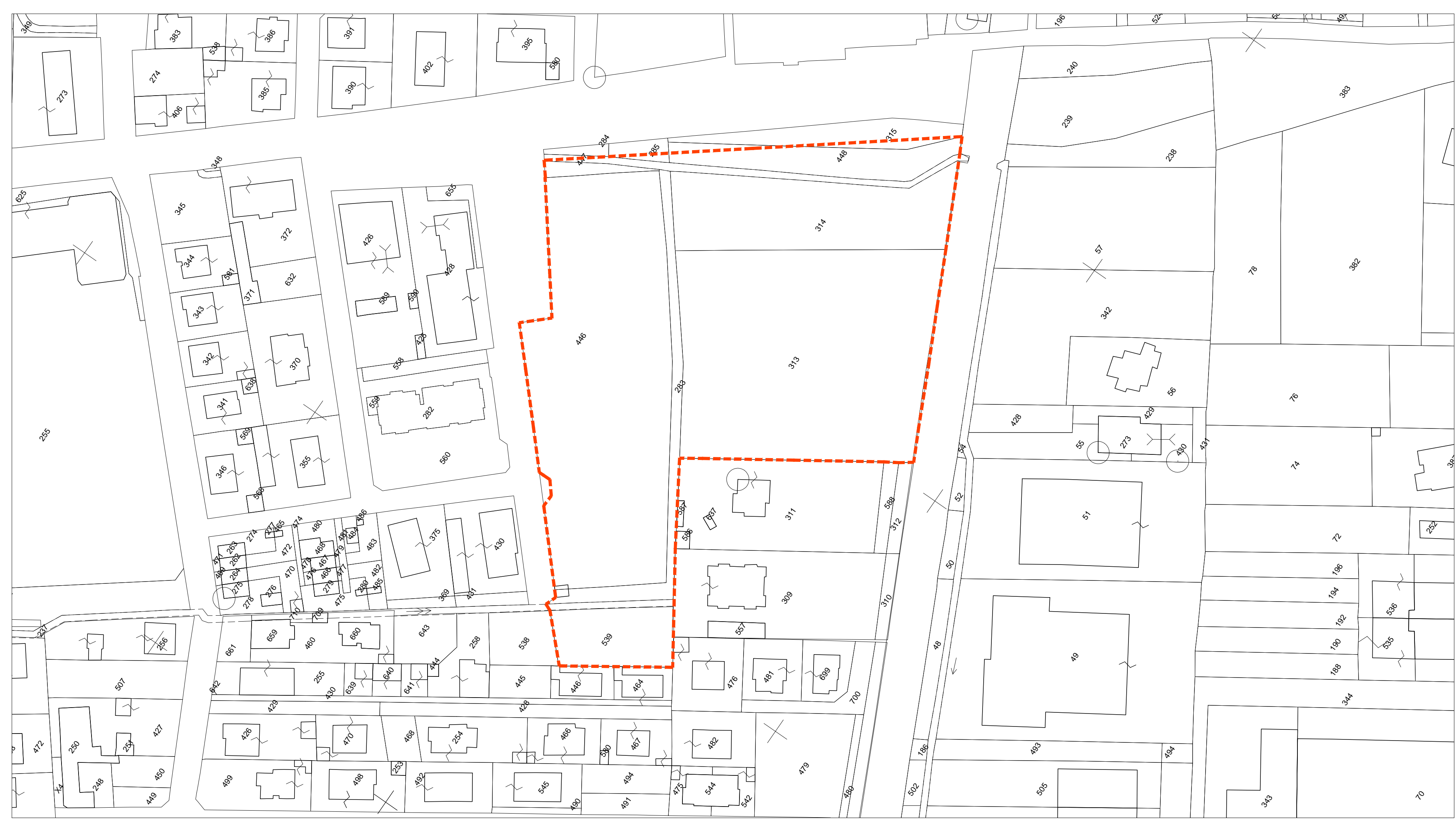
ESTRATTO PLANIMETRIA CATASTALE Comune di Pregana Milanese scala 1:1000